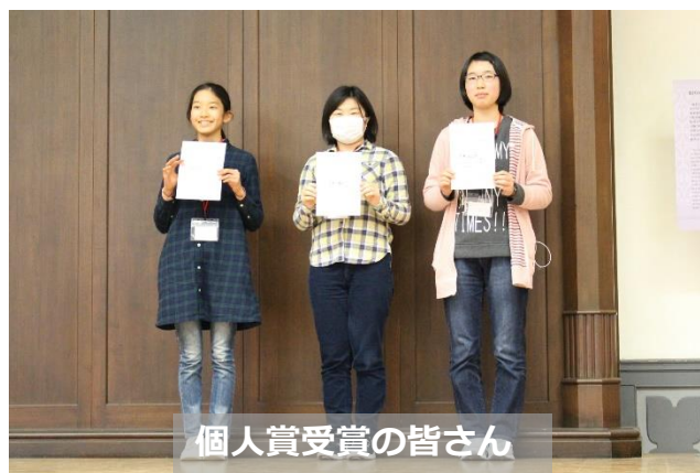
個人賞受賞の皆さん

・いろんな県の、自分と同じくらいの年の人と仲良くなれたし、刺激も受けれたから (中1) ・身近な物でも、すごく奥深いと思った (中1)