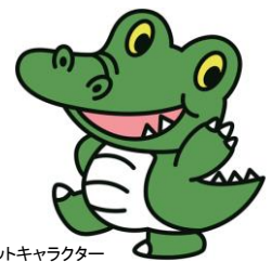
大阪大学 公式マスコットキャラクター 「ワニ博士」